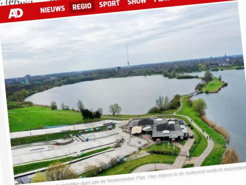
Zicht op het oostelijke deel van de Nedereindse Plas. Hier drijven in de toekomst wellicht duizenden zonnepanelen.