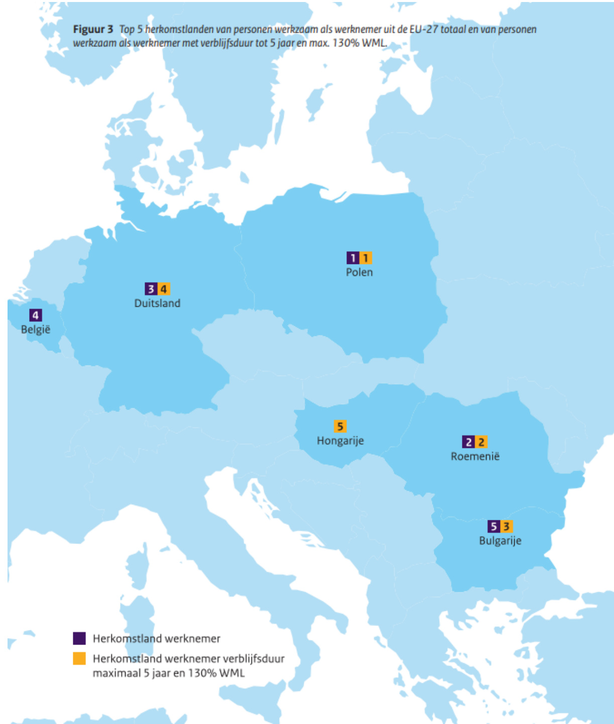
Figuur 3 Top 5 herkomstlanden van personen werkzaam als werknemer uit de EU-27 totaal en van personen werkzaam als werknemer met verblijfsduur tot 5 jaar en max. 130% WML.